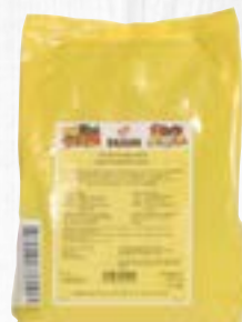
Rahmhaltemittel geliefert in 1-kg-Beuteln

○ Art. 01923200001.0 Veggie-express Tiramisu